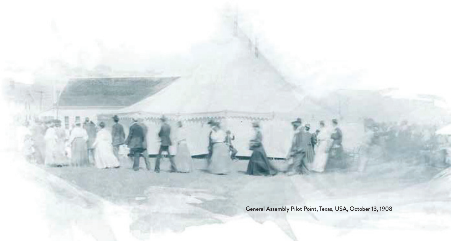
General Assembly Pilot Point, Texas, USA, October 13, 1908

Binaliwan iti makailima a General Assembly (1919) ti nagan iti denominasyon iti Church of the Nazarene. Iti gapuna daytoy ket saanen gamen a parehas iti kaipapananna ti sao a “Pentecostal” ti doktrina iti panagsanto a kas ti pannakausarna idi maudi a paset idi 19th a siglo nga iso iti pannakaibangon ti iglesia. Nagtalinaed a napudno ti denominasyon iti immuna a misyonna nga ikasaba ti ebanghelio iti naan-anay a pannakaisalakan.