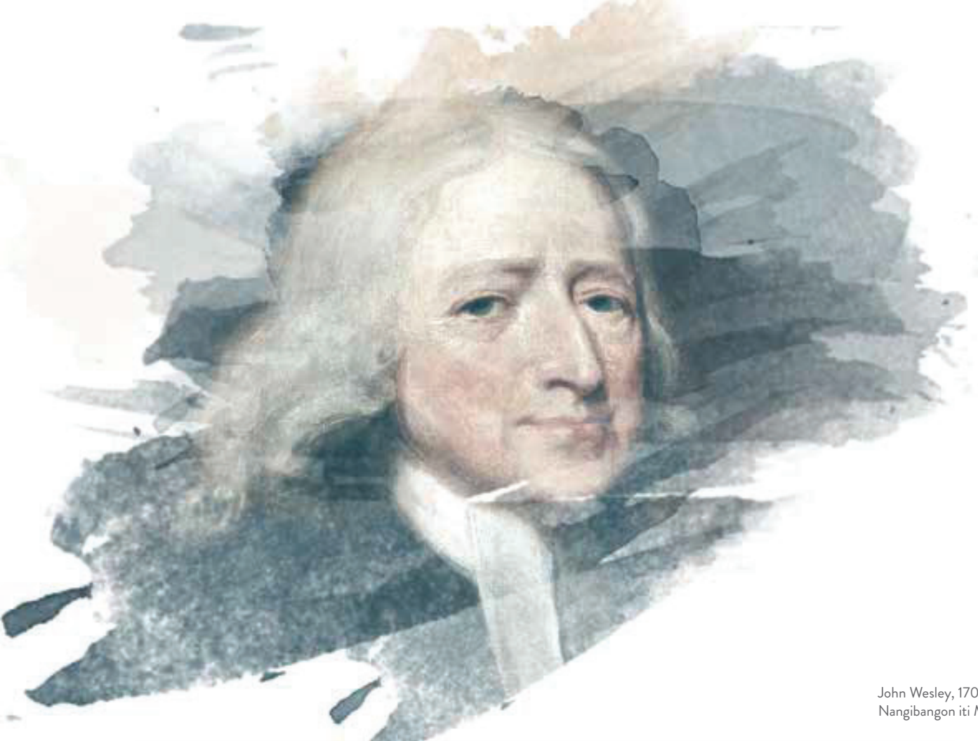
John Wesley, 1703-1791 Nangibangon iti Metodista