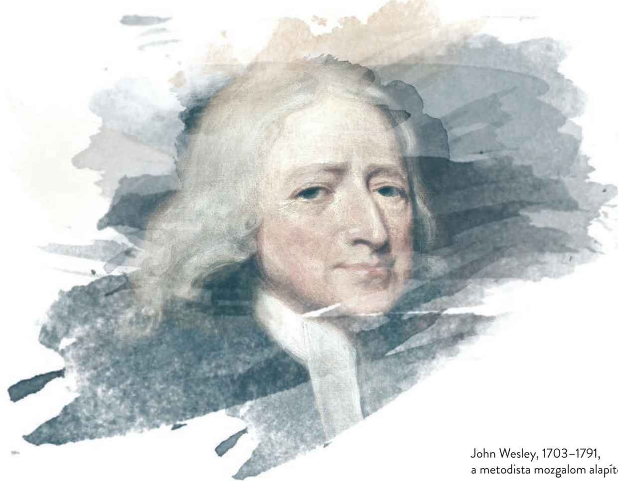
John Wesley, 1703–1791, a metodista mozgalom alapítója.