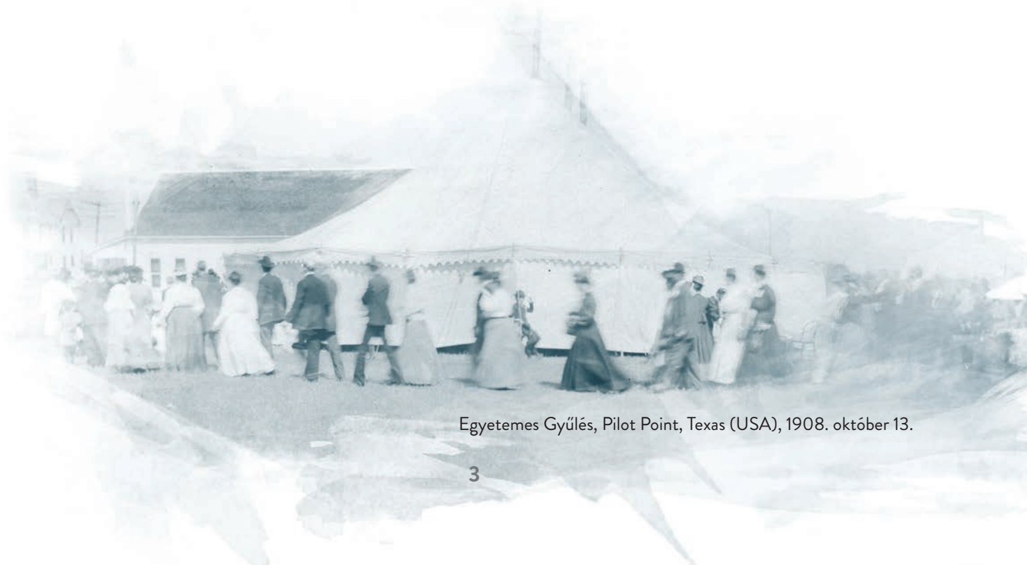
Egyetemes Gyűlés, Pilot Point, Texas (USA), 1908. október 13.

1919-ben az Egyetemes Gyűlés a felekezet nevét Názáreti Egyházra változtatta. A „pünkösdi” szó már nem „a szentség tanát” jelentette, mint a 19. század végén. A fiatal felekezet hű maradt eredeti küldetéséhez, a teljes üdvösség/szabadulás evangéliumának hirdetéséhez.